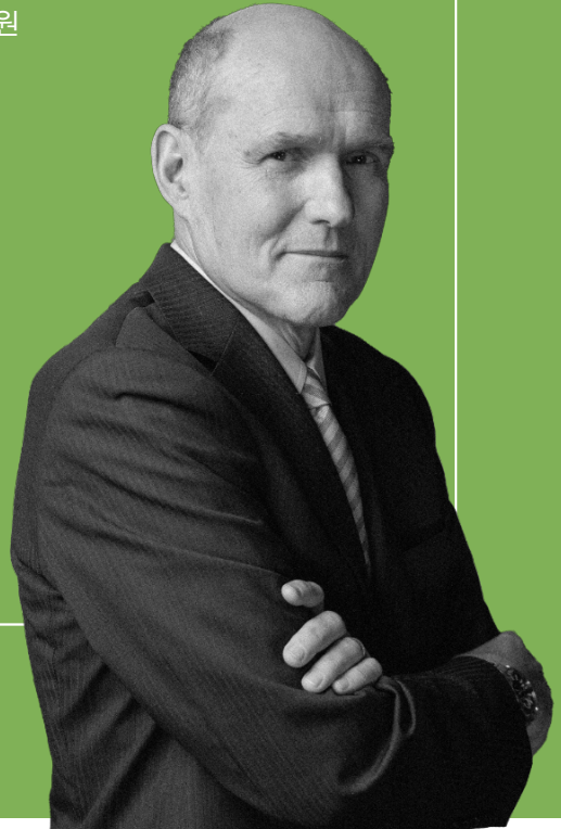
Stephen M. Walt